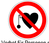
Verbot für Personen mit Herzschrittmacher