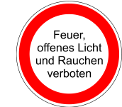
Feuer, offenes Licht und Rauchen verboten