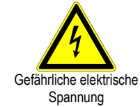
Gefährliche elektrische Spannung