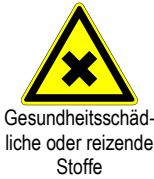
Gesundheitsschädliche oder reizende Stoffe