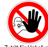
Zutritt für Unbefugte verboten